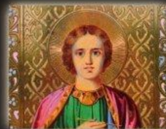
Heiliger Panteleimon (Heiler & Arzt im 3. Jahrhundert)

Viele Menschen können sich unter den Chakren nichts Greifbares vorstellen und doch ist z.B. das Kronenchakra im christlichen Glauben allgegenwärtig. Beispielsweise besitzt jede Heiligendarstellung bzw. jede Engeldarstellung einen Heiligenschein, der ein erleuchtetes bzw. voll geöffnetes Scheitelchakra symbolisiert.